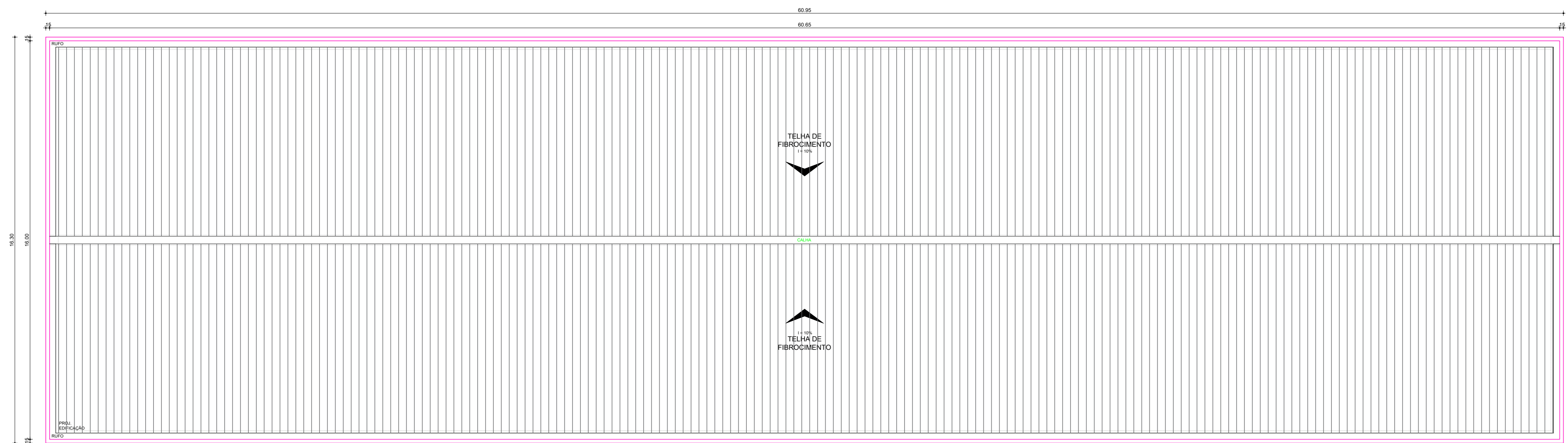
02 PLANTA DE COBERTA ESCALA: 1:125