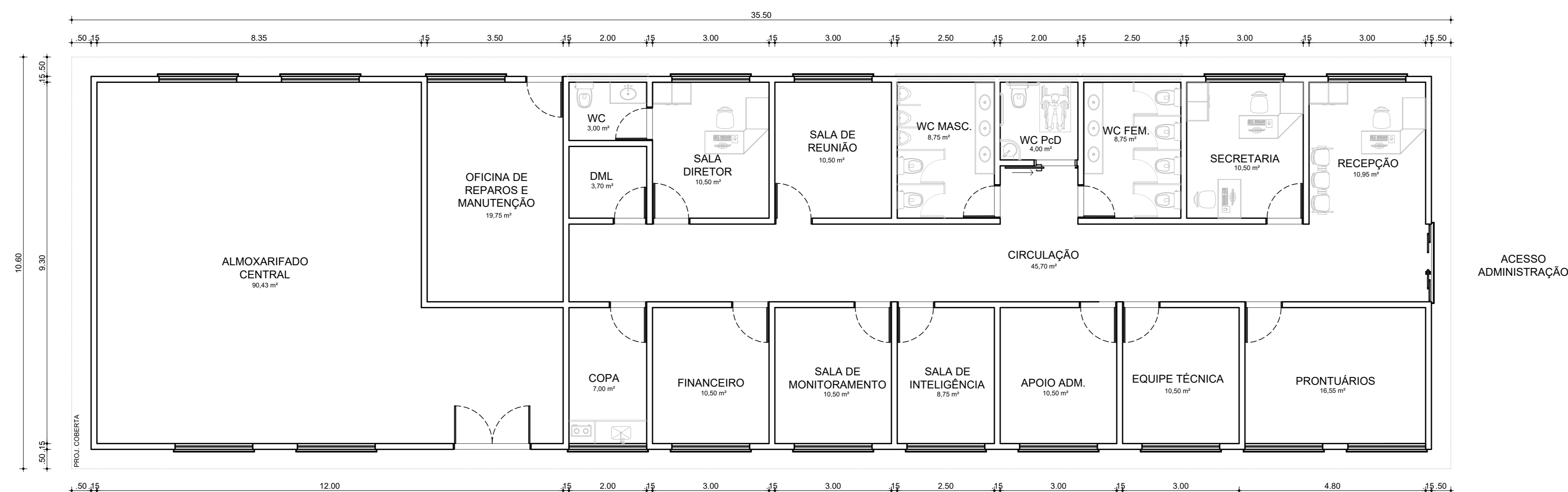
01 PLANTA BAIXA TÉRREO ESCALA: 1:100