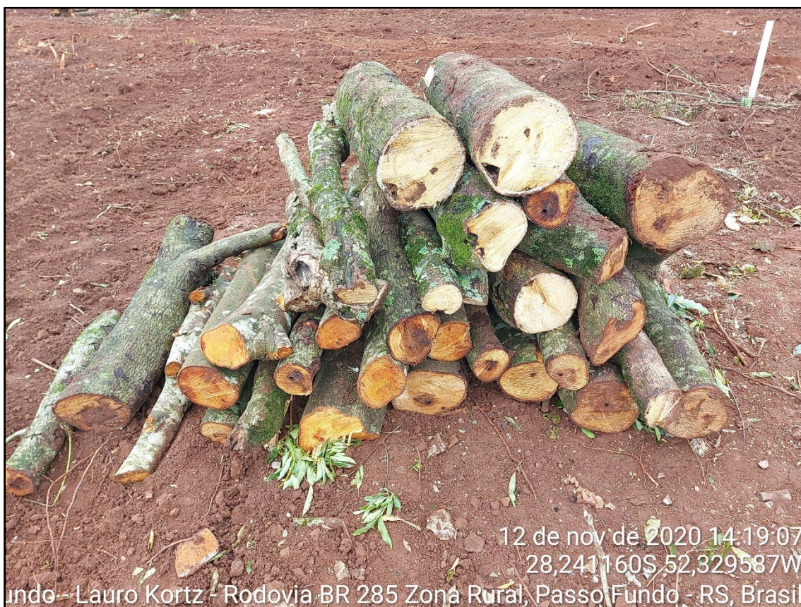
Figura 13: Corte e empilhamento do material lenhoso