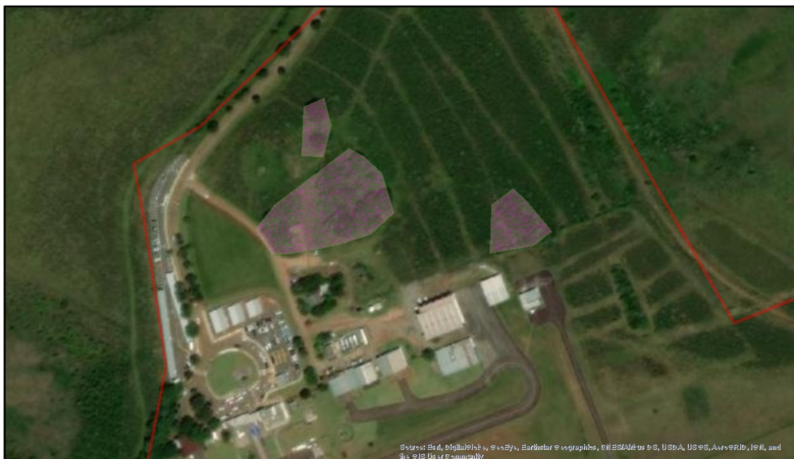
Figura 3: Detalhe da área de intervenção