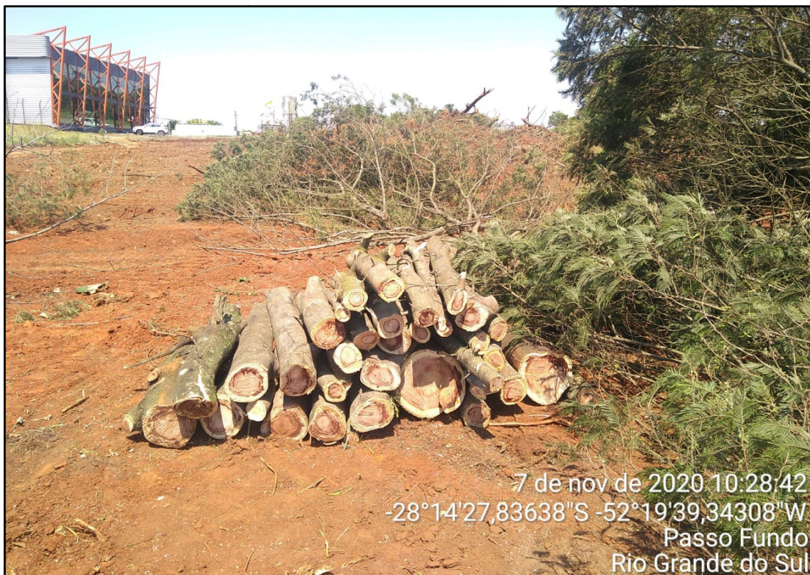
Figura 6: Corte e empilhamento do material lenhoso