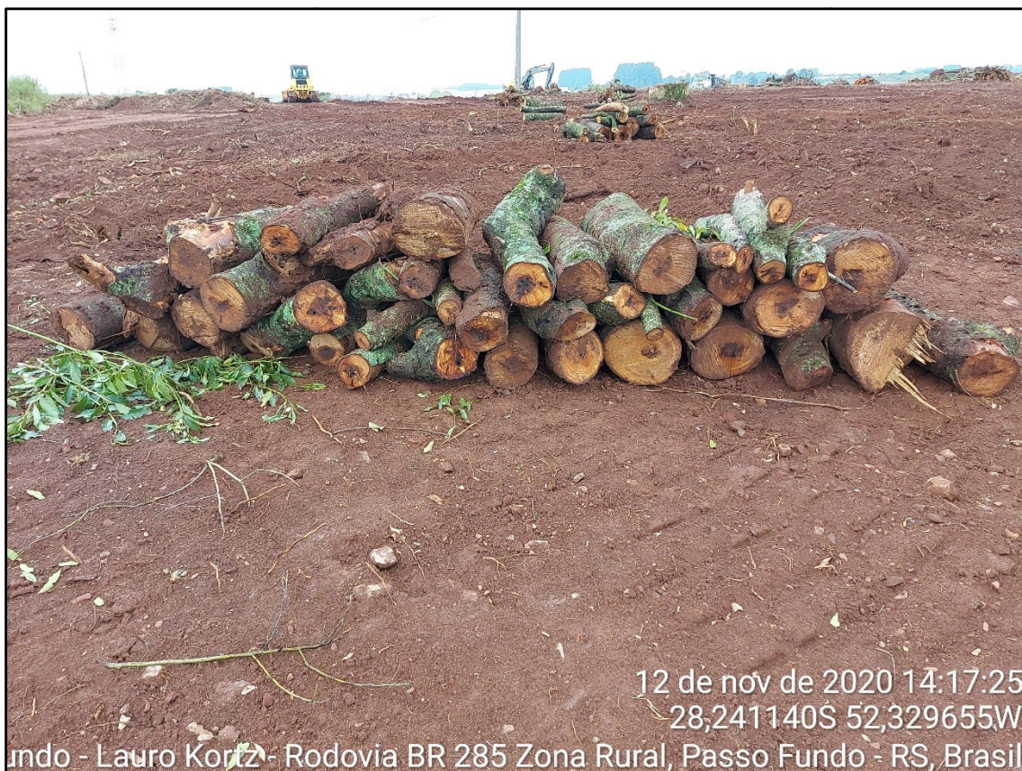
Figura 12: Corte e empilhamento do material lenhoso