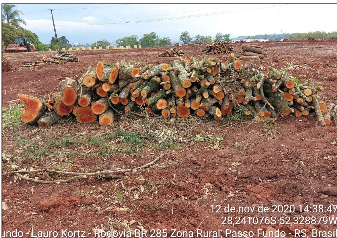
Figura 14: Corte e empilhamento do material lenhoso