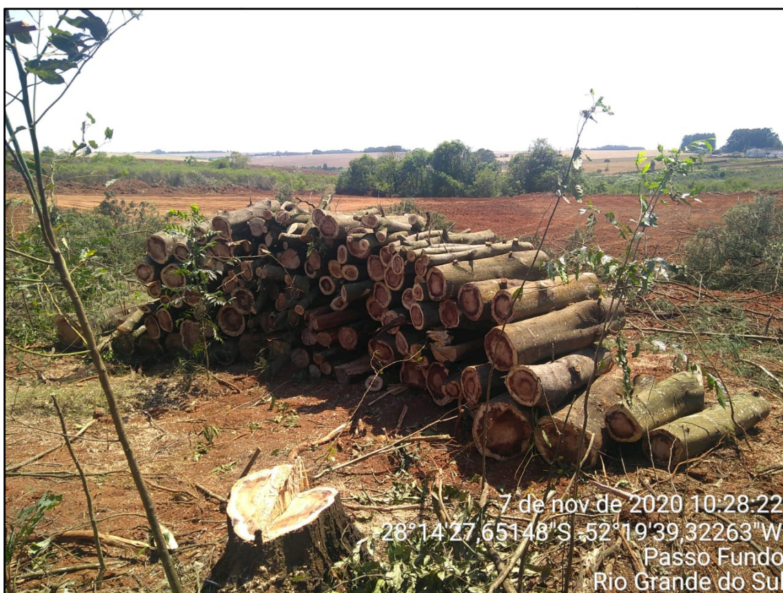
Figura 8: Corte e empilhamento do material lenhoso