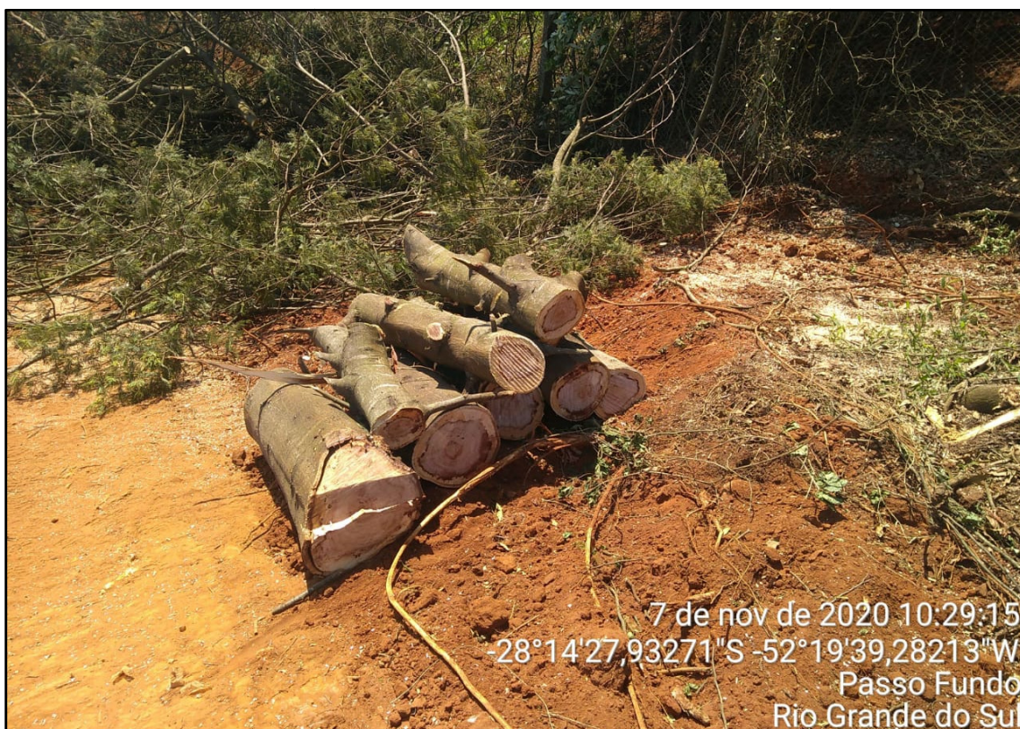
Figura 7: Corte e empilhamento do material lenhoso