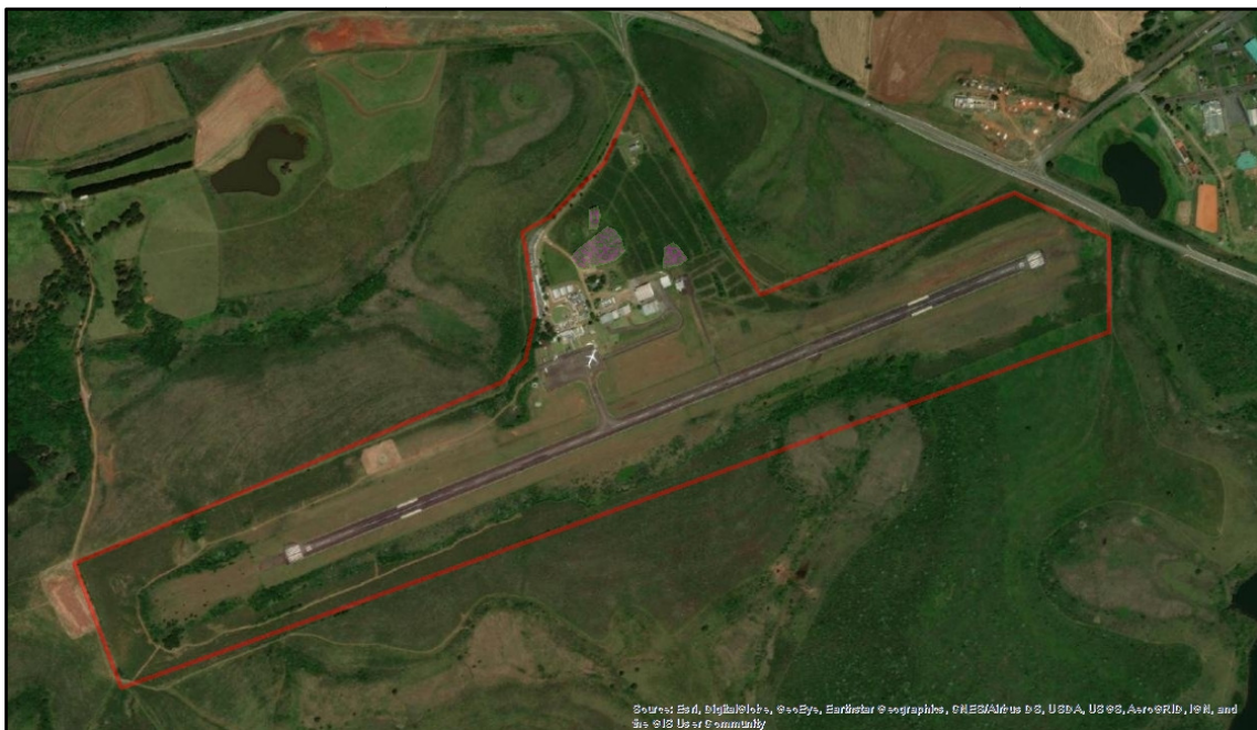
Figura 1: Área de intervenção

A figura abaixo ilustra a área que está sofrendo intervenção.