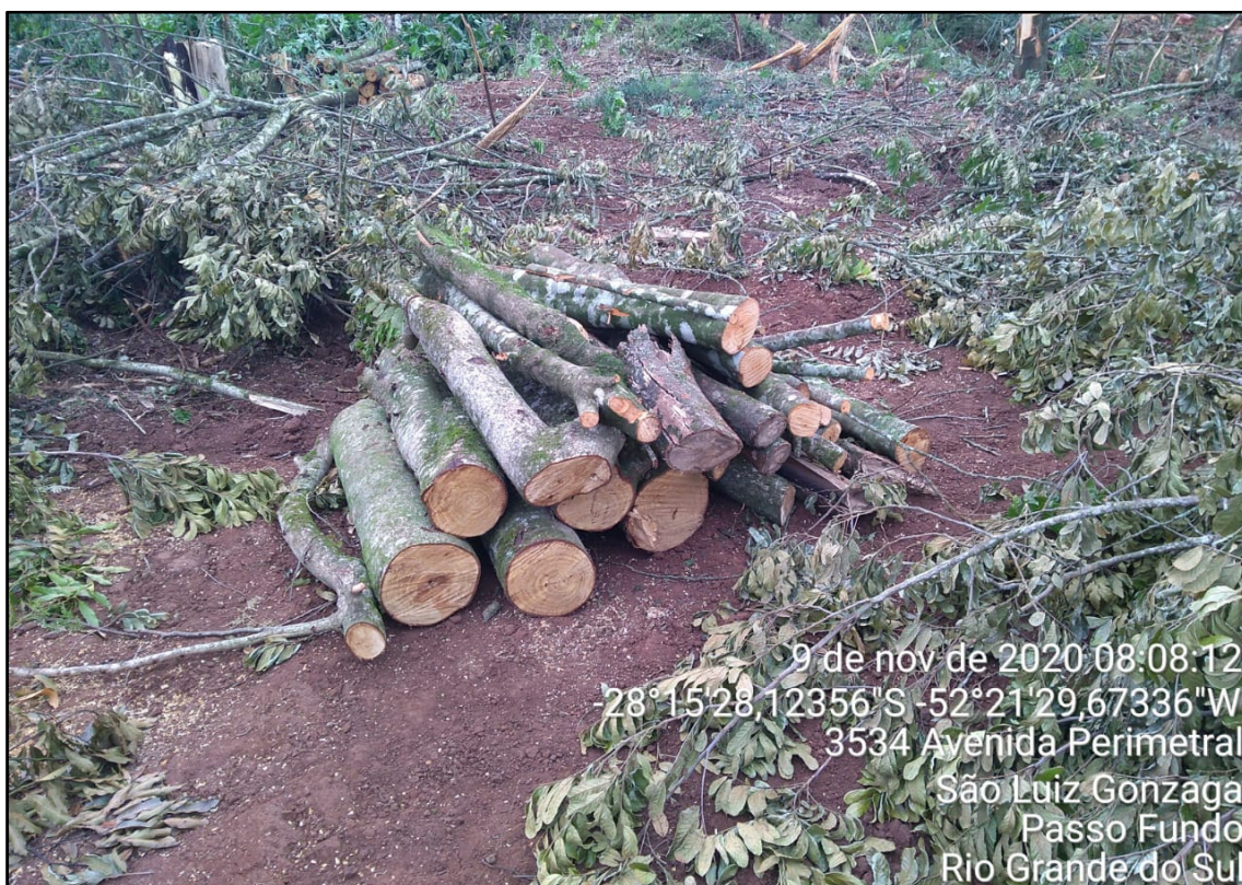
Figura 11: Corte e empilhamento do material lenhoso