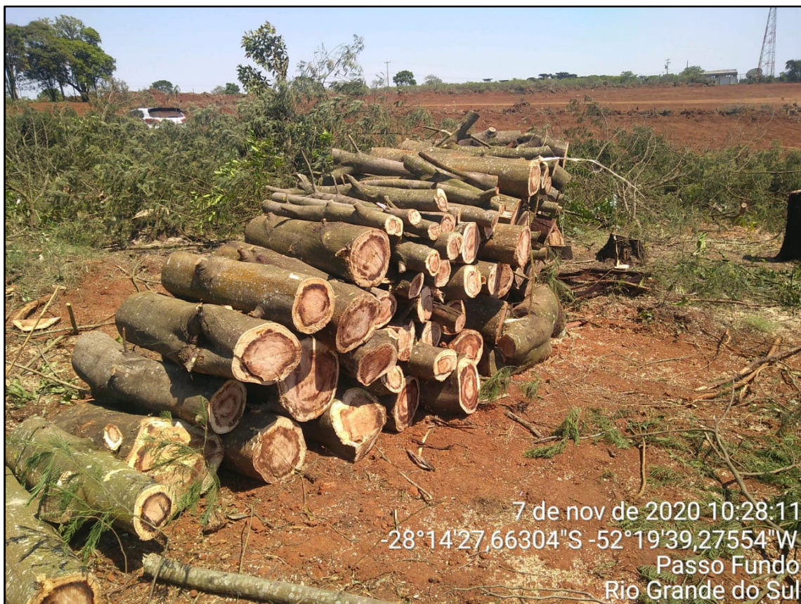
Figura 9: Corte e empilhamento do material lenhoso