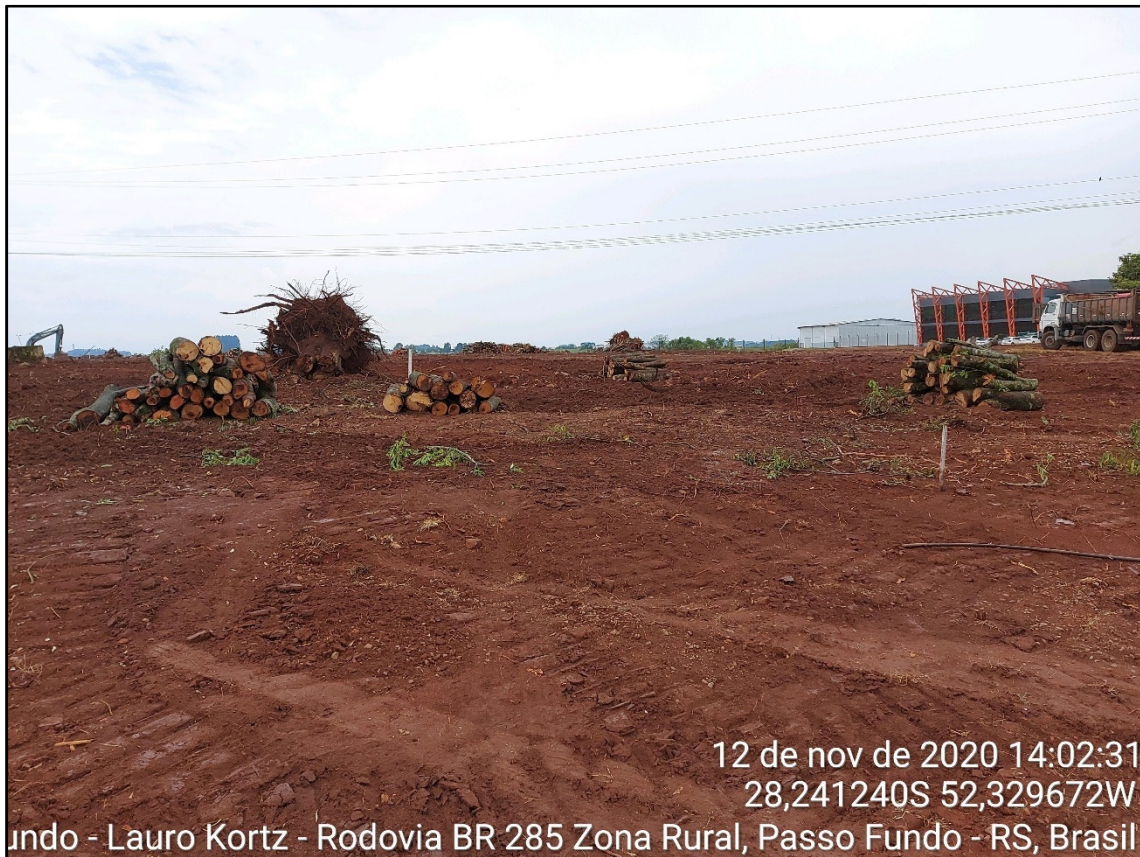
Figura 15: Corte e empilhamento do material lenhoso

A supressão ainda encontra-se em fase de execução.