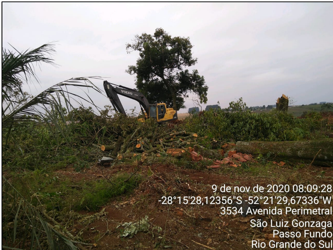
Figura 5: Execução do corte de vegetação