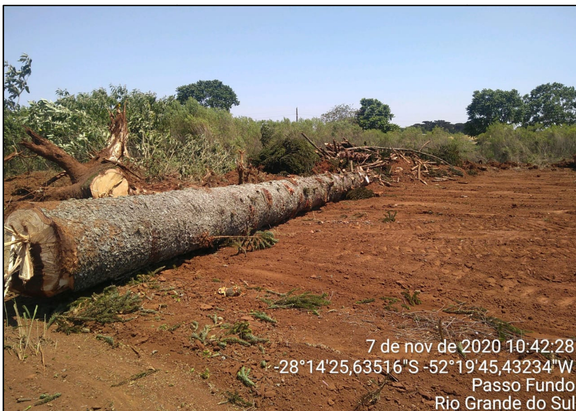
Figura 10: Corte e empilhamento do material lenhoso