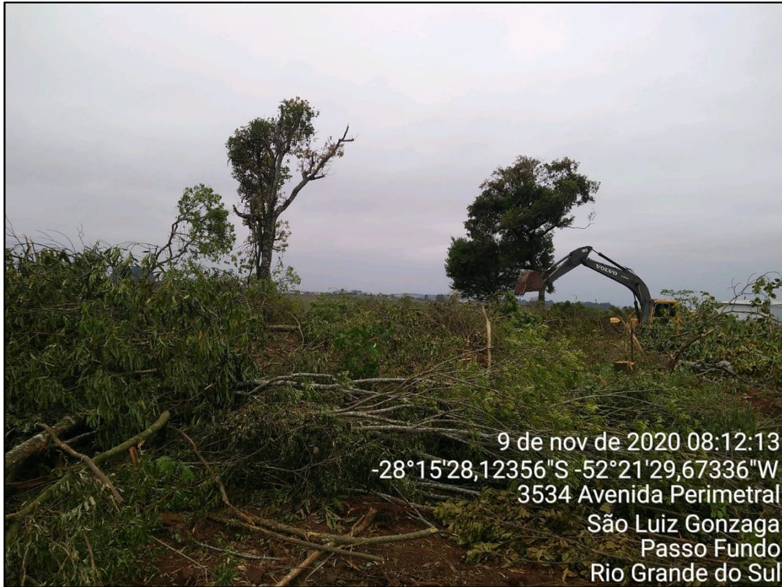
Figura 4: Execução do corte de vegetação